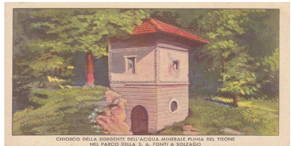
CHIOSCO DELLA SORGENTE DELL'ACQUA MINERALE PLINIA DEL TISONE NEL PARCO DELLA S. A. FONTI A SOLZAGO