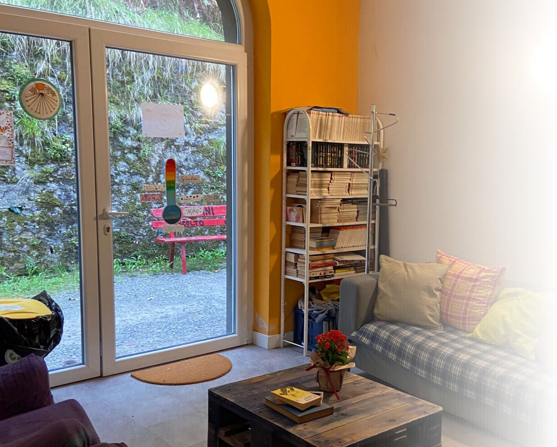
Interno del CD "Il Castagneto"