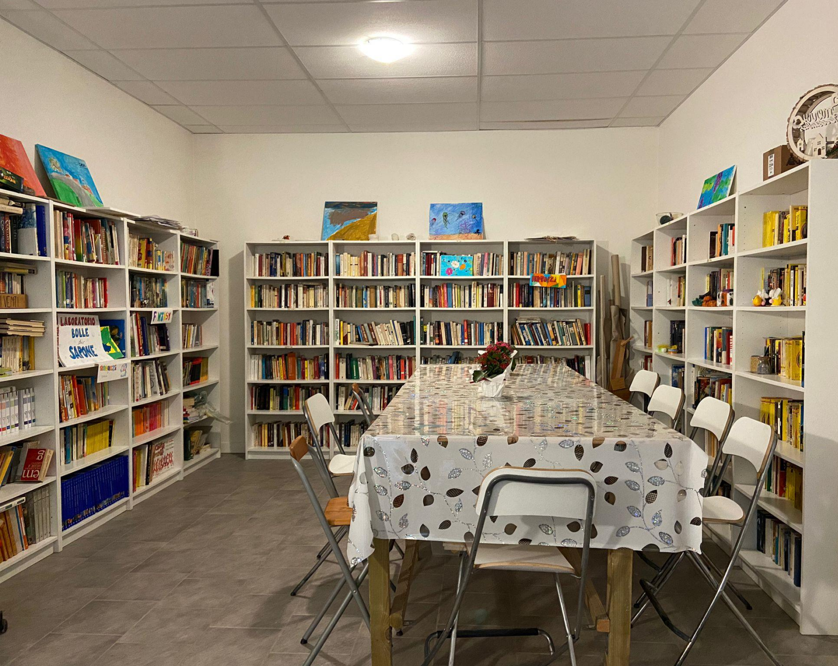
Interno di uno degli spazi del Centro Diurno "Il Castagneto"